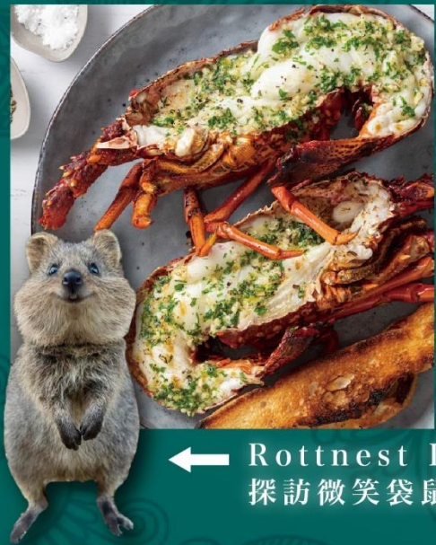
← Rottneest Island 探訪微笑袋鼠 Quokka

[10天][國泰直航]漫遊西澳3城(珀斯·瑪格麗特河·傑拉爾頓). 海陸空粉紅湖. 自然奇觀「波浪岩」. 澳洲廚師帽酒莊 WILLS DOMAIN+ 岩龍海鮮遊船. [罕有住好嘞]瑪格麗特河 PULLMAN 獨立VILLA