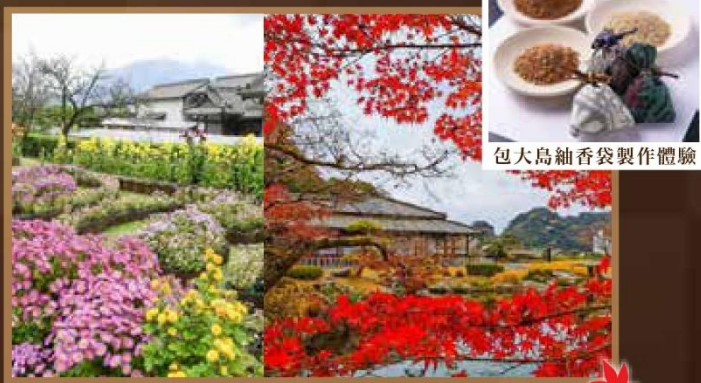
包大島紬香袋製作體驗

建於福岡城遺跡之上，四時變幻的自然之美，是福岡市民休憩的場所。秋季的紅葉美景十分有名，紅色的楓葉及黃色的銀杏妝點在城牆周圍，形成色彩豐富的美麗景觀，別有風味。