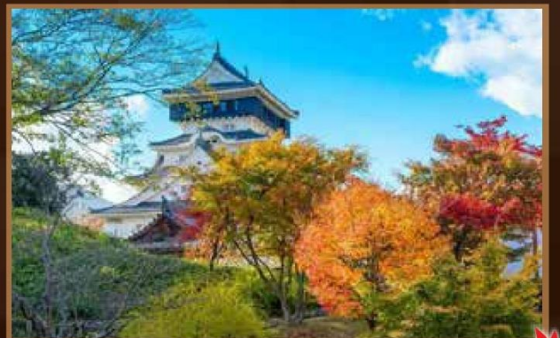
【小倉城勝山公園】紅葉名所

為南九州最大的神宮，也是知名的「能量景點」，座落在霧島山山腳，而霧島山不僅是日本最早被指定為國家公園的火山群，也是日本神話中天孫降臨的地方。