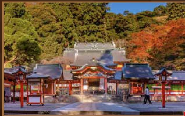
【霧島神宮】鹿兒島唯一國寶

約10萬株向日葵的黃色與雞冠花的紅色構成了一到美麗的風景，享受被向日葵花海包圍的時光。