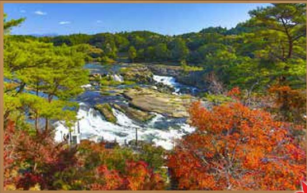
【曾木瀑布】紅葉百選，東洋尼亞加拉之稱

熊本城被稱為日本三大名城之一，以牢不可破、堅不可摧有名，2016年發生的地震令熊本城受損，支撐熊本城的石牆也有不少巨石崩塌連最具代表性的天守閣，屋瓦也被震落。由於熊本城是日本重要文化遺產，每個修復過程都不能馬虎，「一磚一瓦」都得按照最初的模樣，放去原本的位置上。染上紅黃色彩的楓樹與銀杏，將天守閣襯托得更是雄偉壯麗。周邊步道平緩，可悠閒感受城廓威儀。天守閣(約800日圓)可俯瞰城市全景