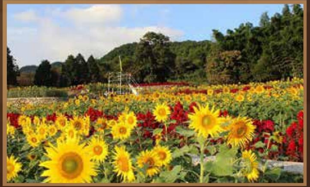
【山田向日葵園】約10萬株

瀑布寬210米、高約12公尺的河水從千層岩上傾洩而下，激起的白色水花及聲響都相當令人震撼，再加上沿岸一片紅葉及銀杏，就像是一幅色彩繽紛的水彩畫。