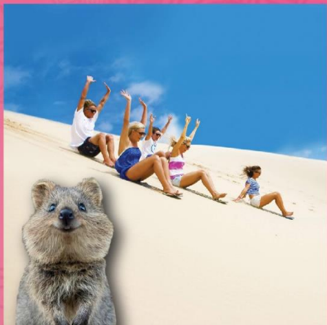
← 探訪微笑袋鼠 Quokka

[8天][慢活親子樂]國泰直航, 觀星導賞之旅, 海陸空粉紅湖雙體驗 6大親子[BUGGY車袋鼠追蹤, 探訪微笑袋鼠QUOKKA, 親親國寶樹熊, 頂級CROWN TOWER海鮮自助餐, 2晚珀斯天鵝谷NOVOTEL渡假村