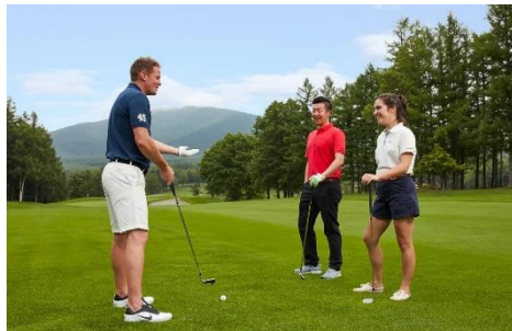
· 高爾夫球俱樂部 & 課程期間練習球