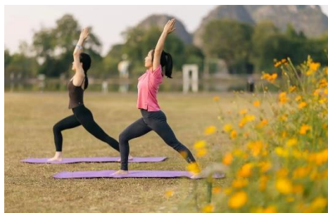
· 瑜珈-哈達瑜珈、陰瑜珈、流瑜珈、槳板瑜珈