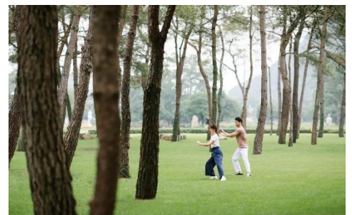
· 健身學校-太極、尊巴(Zumba)