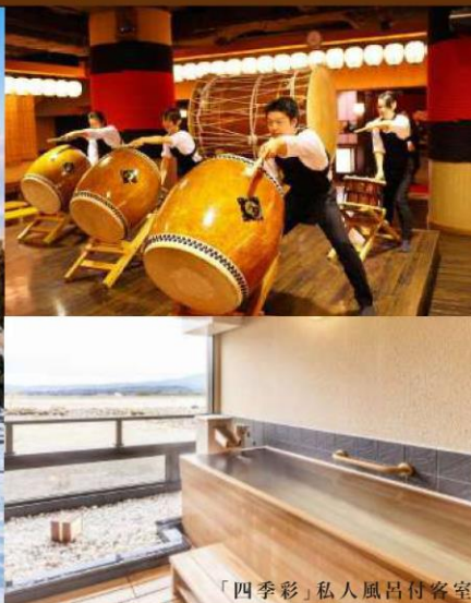
「四季彩」私人風呂付客室