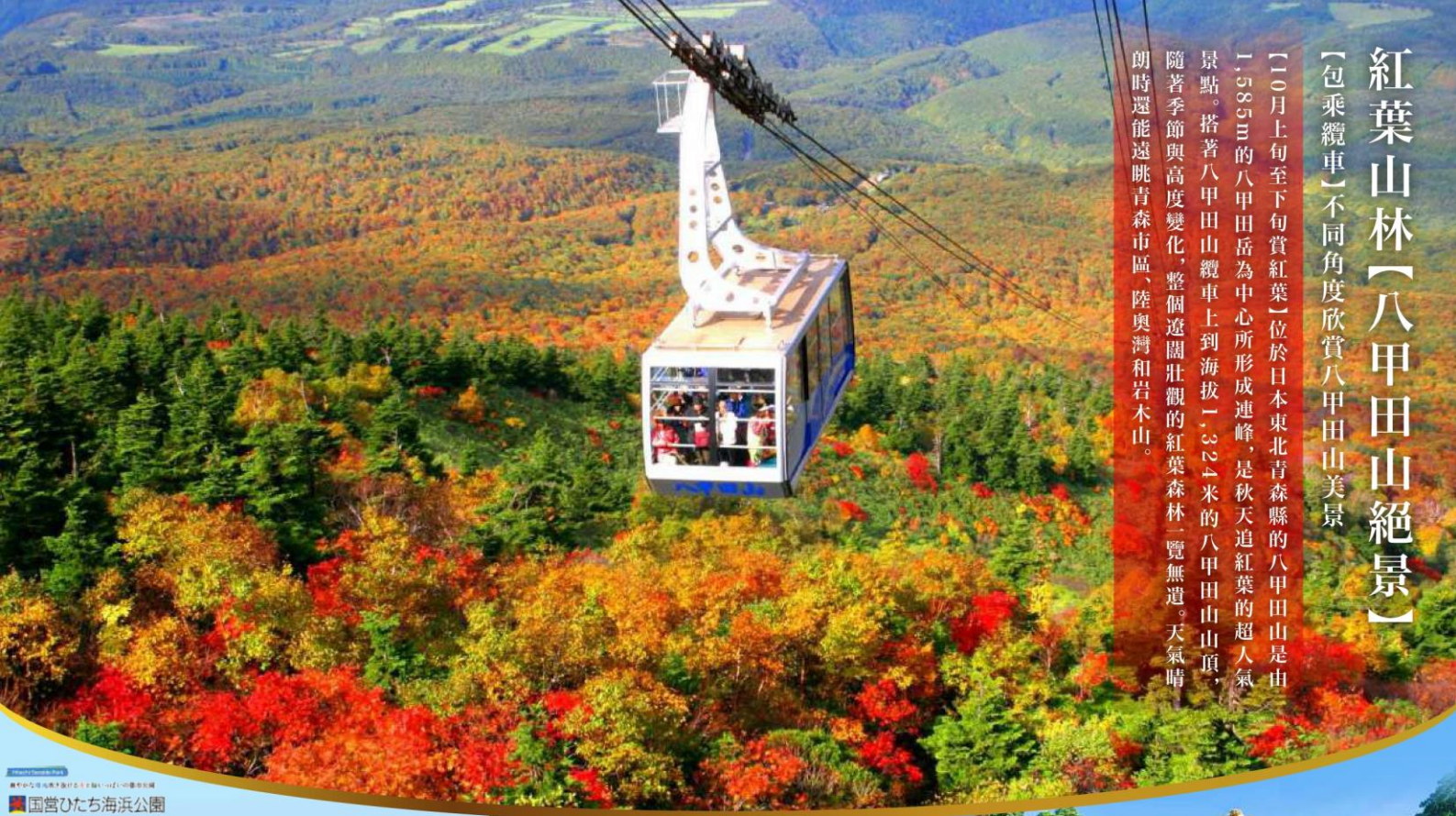
国営ひたち海浜公園

【10月上旬至下旬賞紅葉】位於日本東北青森縣的八甲田山是由1,585m的八甲田岳為中心所形成連峰，是秋天追紅葉的超人氣景點。搭著八甲田山纜車上到海拔1,323米的八甲田山山頂，隨著季節與高度變化，整個遼闊壯觀的紅葉森林，覽無遺。天氣晴朗時還能遠眺青森市區、陸奧灣和岩木山。