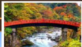
日本三大奇橋【神橋】

位於日光市山內，祭祀江戶幕府第一代將軍德川家康的東照宮，豐富的歷史古蹟，令其以「日光的社寺」的一部分，於1999年列入世界遺產。東照宮的建築精雕細刻、金碧輝煌，座落於日光群山之中，依山而建，氣勢十足。當中的日本風格的明陽門和中國風格的唐門是其代表建築。