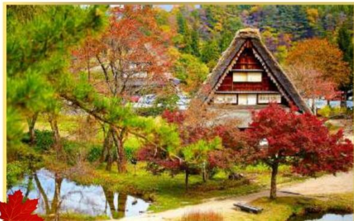
10月下旬至11月上旬賞紅葉