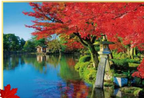
11月上旬至下旬賞紅葉

白川郷合掌村有如童話中薑餅屋的造型吸引了不少人前往。合掌屋只用繩子與木材搭建，完全不使用釘子，屋頂以上高地厚厚的茅草覆蓋，外形有如兩手合握。