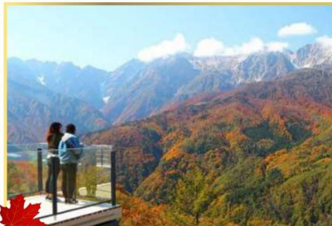
10月上旬至11月中旬賞紅葉

兼六園以多個池塘、溪流、瀑布、小橋、茶座、樹木、石頭和鮮花建構一個美麗歷史名園。是日本屈指可數、兼具寬廣及美景的林泉迴遊式大庭園。