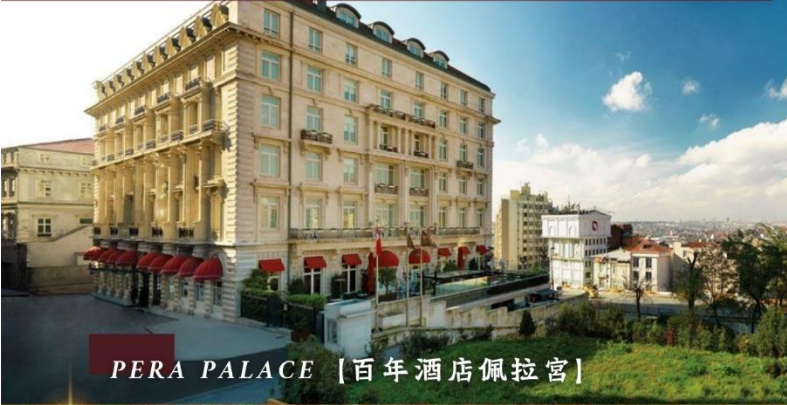
PERA PALACE [百年酒店佩拉宮]