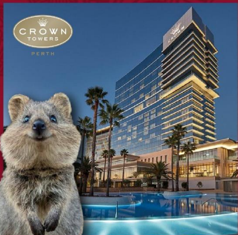
← 探訪微笑袋鼠 Quokka

[8天][國泰直航]西澳珀斯, 飛機遊粉紅湖, 獵犬黑松露探索之旅, 提升珀斯5星CROWN TOWERS & PULLMAN BUNKERS BAY 400呎露台房間, 西澳岩龍蝦, 即捕即食龍蝦海鮮盛宴, 360旋轉餐廳C RESTAURANT