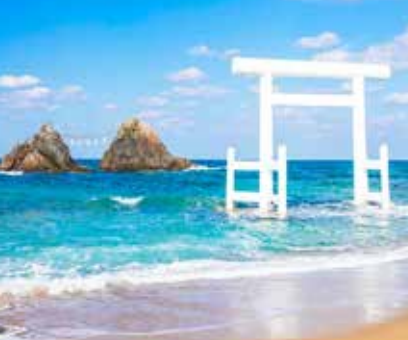
【櫻井二見浦夫婦岩+白色鳥居】

矗立在海邊的白色鳥居、一大一小連結著注連繩的夫婦岩，成為海邊一道莊嚴又神秘的絕景。