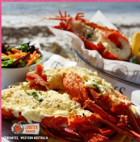
LOBSTER SHACK PERVANTES, WESTERN AUSTRALIA