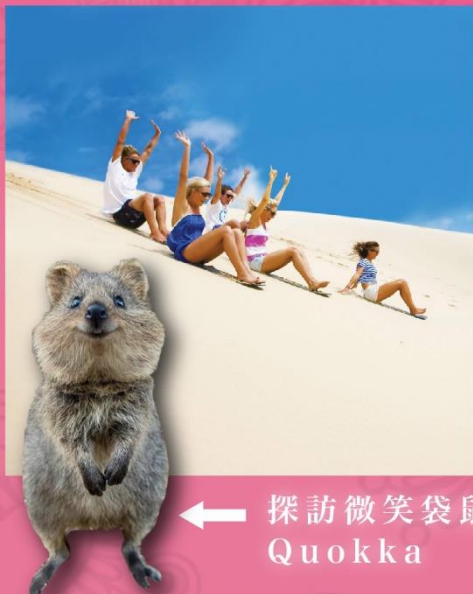
← 探訪微笑袋鼠 Quokka

[8天][慢活親子樂]國泰直航, 觀星導賞之旅, 海陸空粉紅湖雙體驗 6大親子[BUGGY車袋鼠追蹤, 探訪微笑袋鼠QUOKKA, 親親國寶樹熊, 頂級CROWN TOWER海鮮自助餐, 2晚珀斯天鵝谷NOVOTEL渡假村