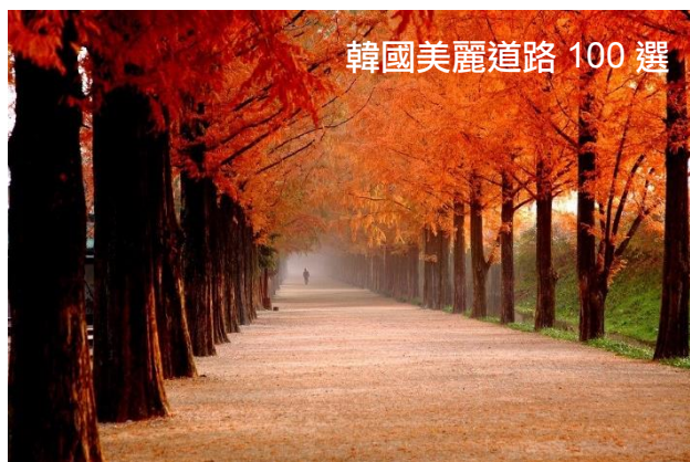
韓國美麗道路 100 選

韓國人氣 No.1 的楓葉山，內藏山名字含「山內所藏無窮無盡」的意思。十四座連峰層層圍繞，淡雅的內藏寺、白羊寺等歷史悠久的古寺都在此地。每逢秋天，內藏山層林盡染，火紅的楓葉、褐色的槲櫟和黃色的樺樹，常青的交趾木與榿子樹星星點點，互相輝映，古剎秋色，就像一幅色彩絢麗的油畫，美景醉人。【秋楓大道～內藏寺～白羊寺】(10月中旬至11月中旬賞紅葉)(樹林環抱，秋天層林盡染，有「韓國第一楓葉山」之稱，襯托古寺，欣賞古剎秋色)。