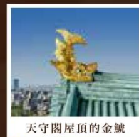
天守閣屋頂的金鯱

【9至10月賞波斯菊、金盞花、掃帚草等；10至11月賞紅葉】花卉與動物的主題樂園，因在高原上氣候溫差大，開出的花朵特別漂亮。還能與農場裡的動物接觸交流，除了牛、羊、馬、兔子等可愛動物外，還有高人氣的園區代表動物草泥馬。