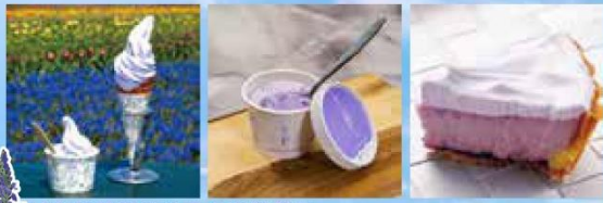
可自行購買必嗜薰衣草製甜品