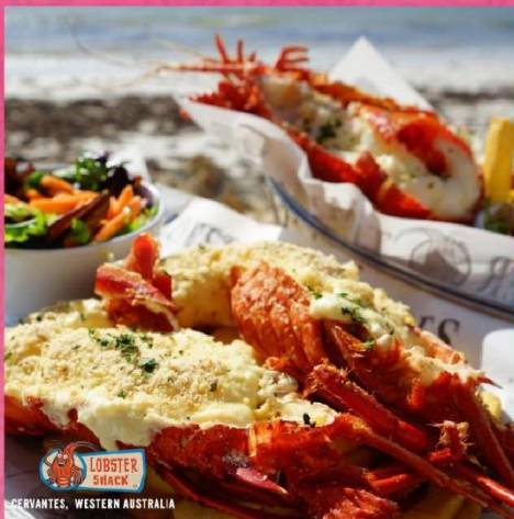
LOBSTER SHACK PERVANTES, WESTERN AUSTRALIA