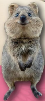
← 探訪微笑袋鼠 Quokka