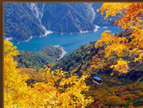
【大觀峰】 9月下旬~10月中旬