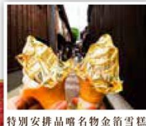
特別安排品嚐名物金箔雪糕