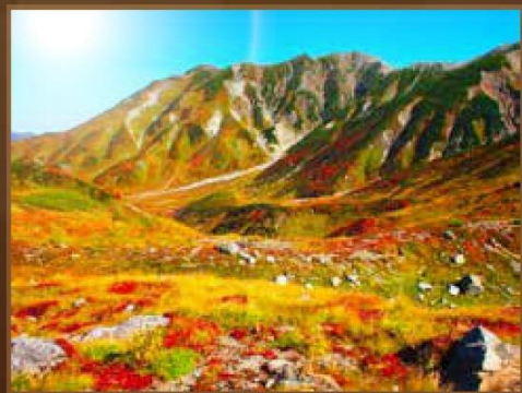
【室堂】 9月中旬~10月上旬

立山黒部是日本最早紅葉變色的地區之一，位於高海拔的紅葉會率先變紅，由山頂至山腳漸漸變色。