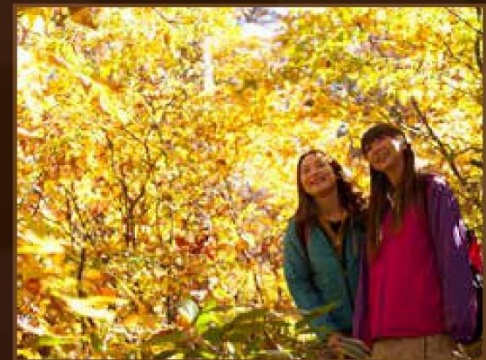
【美女平】 10月中旬~10月下旬