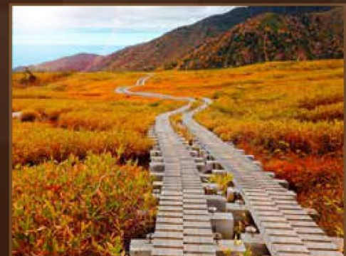
【彌陀原】 9月下旬~10月上旬