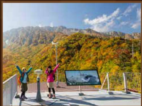
【黒部平】 9月下旬~10月中旬