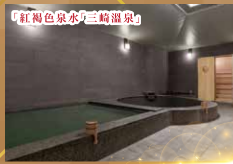
「紅褐色泉水」三崎溫泉