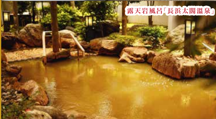
露天岩風呂「長濱太閤溫泉」