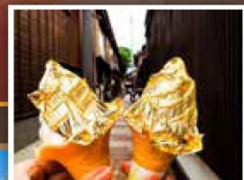
特別安排品嚐名物金箔雪糕

300年前居民為了適應山谷環境，將木造住家屋頂設計成60度斜角的正三角形，除了可以抵擋寒風外，這角度也使得屋頂可以承載厚重積雪，同時讓過高積雪自然崩落。除此之外，合掌屋只用繩子與木材搭建，完全不使用釘子，屋頂以厚厚的茅草覆蓋，外形有如兩手合握，看似簡單的構造卻經得起風吹雨打、大雪、地震的考驗，體現先人的智慧！