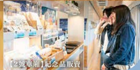
【2號車廂】紀念品販賣