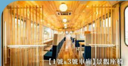
【1號&3號車廂】景觀座椅