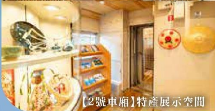
【2號車廂】特產展示空間