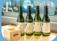
名水及富山米釀成 有名富山地酒(約900-1300日圓)

一大特色是在設有現場調理料理的開放式廚房，嚴選來自富山灣時令食材，即場製作富山灣壽司、海鮮小菜及茶碗蒸，以舌尖細細品嚐富山大自然的肥沃豐饒。甜點則享用富山百年老舖「引網香月堂」上生菓子。登車時，還會提供迎賓飲品—高岡國吉蘋果汁，天然蘋果的甜味充分保留，不加一滴水。