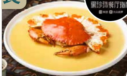
貼心安排最少1餐「黑珍珠評級美饌」