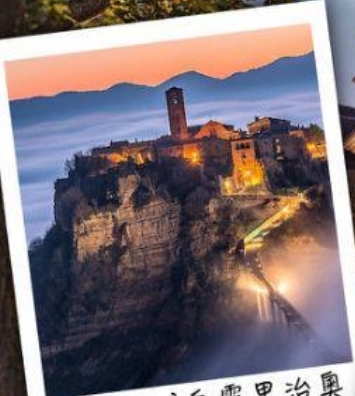
天空之城白露里治奧