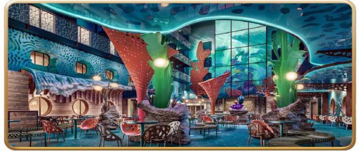
Disney Discovery Reef