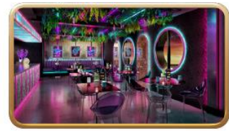
Bewitching Boba & Brews