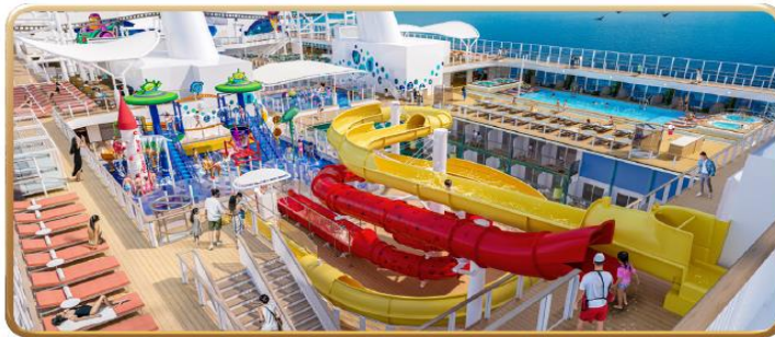
Toy Story Place