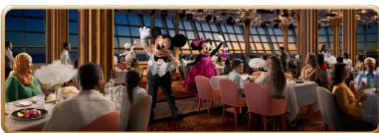
Hollywood Spotlight Club