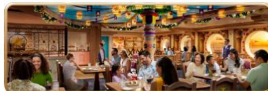
Enchanted Summer Restaurant