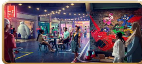
San Fransokyo Street