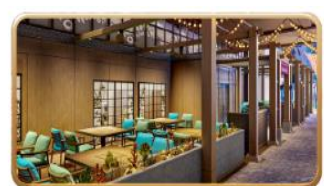
Mike & Sulley's