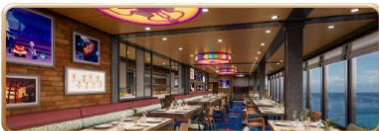
Pixar Market Restaurant