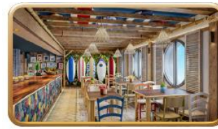
Stitch's 'Ohana Grill