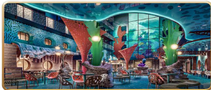
Disney Discovery Reef