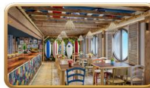
Stitch's 'Ohana Grill