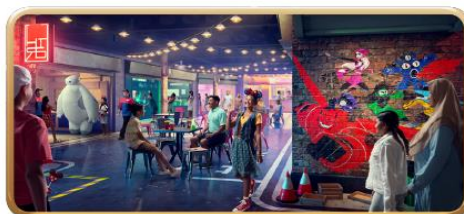
San Fransokyo Street