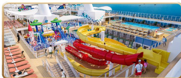
Toy Story Place