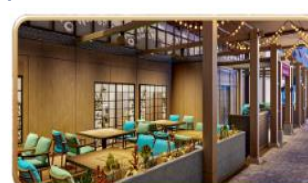
Mike & Sulley's