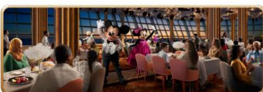
Hollywood Spotlight Club