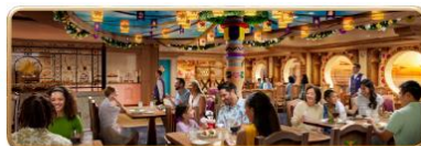
Enchanted Summer Restaurant