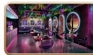
Bewitching Boba & Brews