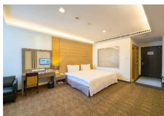
【南投 日月潭】 承萬尊爵渡假酒店