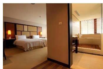
【台北 房內私人溫泉】 水美溫泉會館