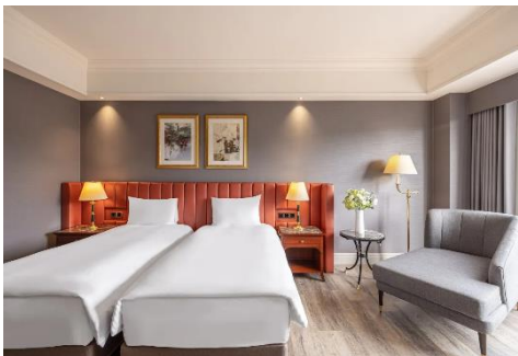
【新竹】 煙波大飯店 (約 390 呎)