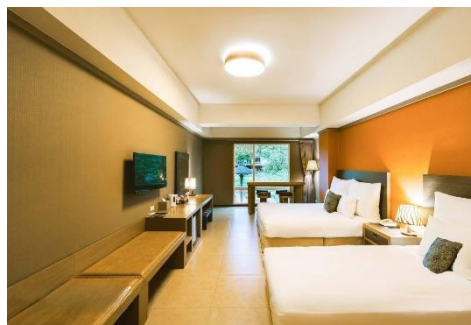
【桃園】 關西六福莊度假酒店 (約 430 呎)