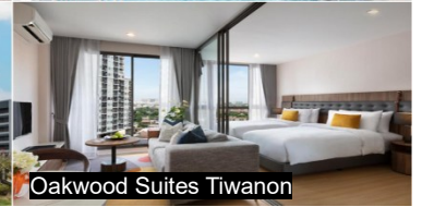
Oakwood Suites Tiwanon