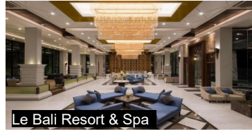
Le Bali Resort &amp; Spa

Oakwood Suites Tiwanon(約 480 呎) 或 Taya Bangkok (約 350 呎)