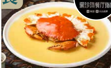
貼心安排最少1餐「黑珍珠評級美饌」