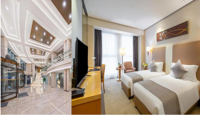
【上海 國際品牌】 富豪金豐酒店