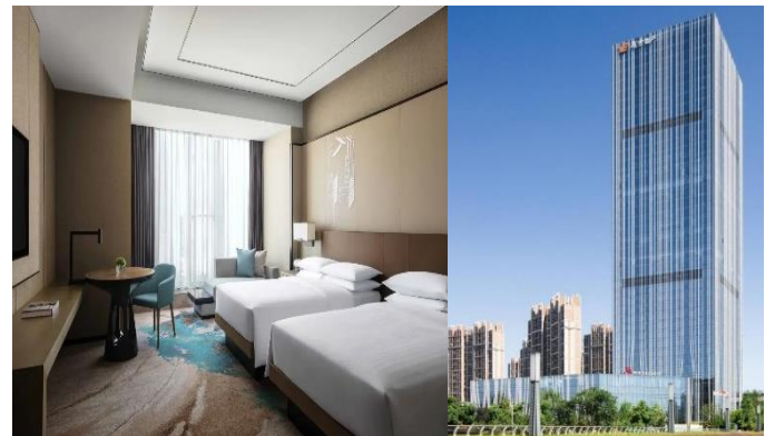
【杭州 國際品牌】 臨安萬豪酒店