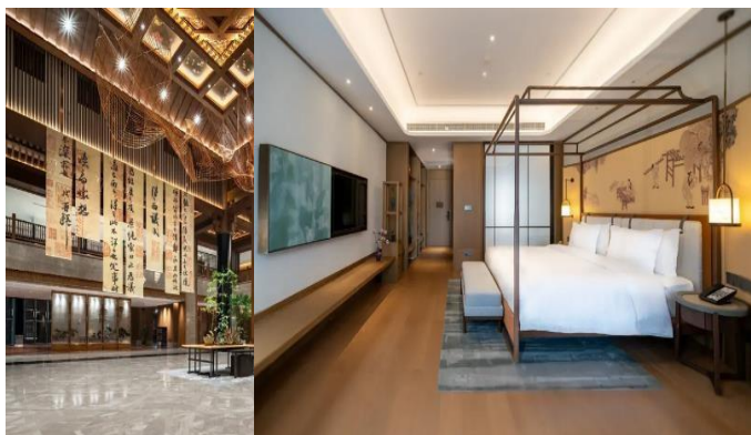
【窯湖小鎮】 窯湖大酒店