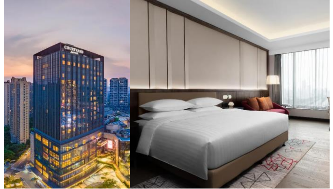
【蘇州 國際品牌】 合景萬怡酒店