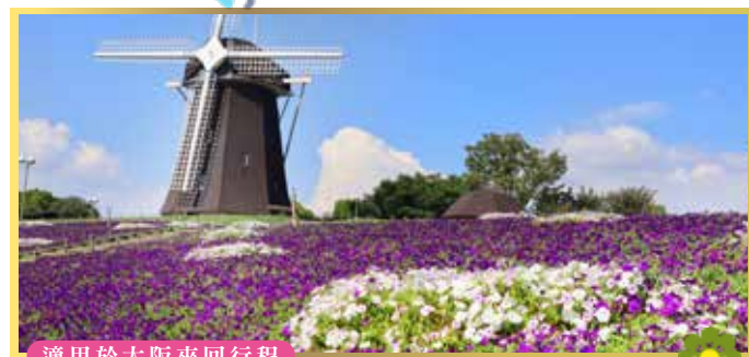
適用於大阪來回行程

日本首座結合大型購物中心+Outlet暢貨中心的複合商場，擁有超過250家店舖。LaLaport門真(1F&3F): 主打最新流行時尚、生活雜貨與家電，品牌包括無印良品、LoFt、GU、UNIQLO、H&M，還有話題美食區「黑門市場」。Mitsui Outlet Park 大阪門真(2F): 匯集COACH、BEAMS、New Balance、Nike、Adidas、Champion等人氣品牌，以Outlet價格入手精品與運動潮牌。