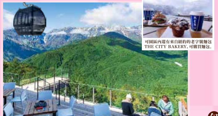
可園區內還有來自紐約的老字號麵包 THE CITY BAKERY, 可購買麵包。

沿著山葵田間小徑漫步，拍攝經典的水車小屋與象徵幸福的橋樑，感受恬靜悠然的鄉野風光。還有名水百選的泉水、大王神社，以及神秘的大王窟等。推薦必吃山葵雪糕(約450日圓)。