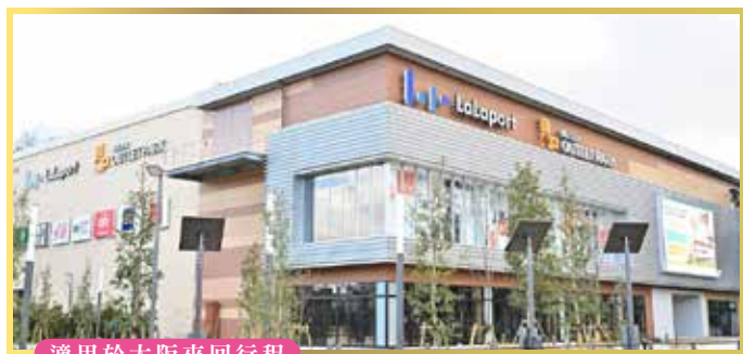
適用於大阪來回行程