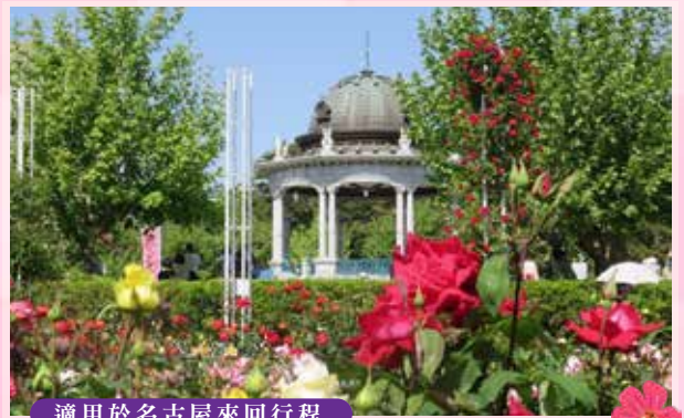
適用於名古屋來回行程

【4月上旬至中旬賞櫻】是日本屈指可數、兼具寬廣及美景的林泉迴遊式大庭園。以多個池塘、溪流、瀑布、小橋、茶座、樹木、石頭和鮮花建構一個美麗歷史名園。「兼六園」其名意為：有六種特質的花園。這六種特質包括宏大、幽邃、巧思、蒼古、水源和壯麗。