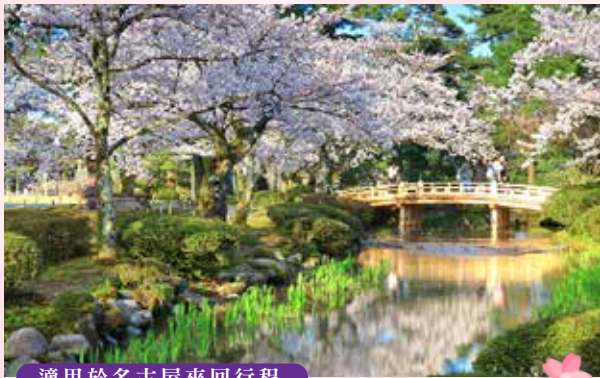
適用於名古屋來回行程

【4月中旬至5月上旬賞櫻】300年前為了適應山谷環境，將屋頂設計成60度斜角的正三角形，除了抵擋寒風外，也使得屋頂可以承載厚重積雪，同時讓過高積雪自然崩落。除此之外，合掌屋只用繩子與木材搭建，完全不使用釘子，屋頂以厚厚的茅草覆蓋，外形有如兩手合握。座落在群山環繞中，與櫻花交織，一旁有源於飛驒山脈的雪水形成的河流，漫步於其中宛如走入童話世界裡的薑餅屋中！