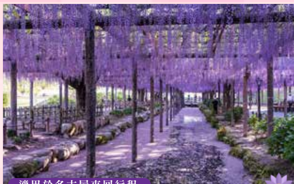
適用於名古屋來回行程

【4月24日起出發前往】【4月中旬至5月上旬賞杜鵑花，5月中旬起賞玫瑰、花菖蒲、繡球花】於1909年開園，建築風格日洋融合，是名古屋第一個都市公園，同時因為名勝地而被登錄為日本的天然紀念物。西側以噴泉塔為中心，花壇和玫瑰園延伸的西式花園，東側是擁有蝴蝶池、菖蒲池的日本庭園。