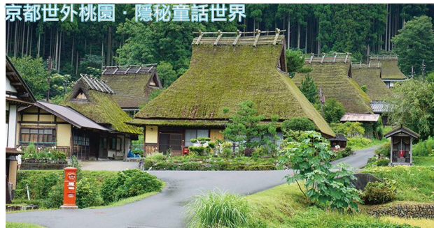
京都世外桃園·隱秘童話世界

日本現存三大合掌村之一，被群山圍繞遠離繁囂，擁有舊時日本農家景色，保留了眾多的獨特合掌屋，已被列為日本國家重要傳統建造物群保存地區。目前擁有 39 棟與別不同的獨特合掌屋，純樸寧靜，跟白川鄉合掌村擁有著不一樣的風味，景色非常夢幻。可自行前往參觀美山民俗資料館(約 300 日圓)，除了可窺見合掌屋的建築結構外，更能了解以前古人的生活。