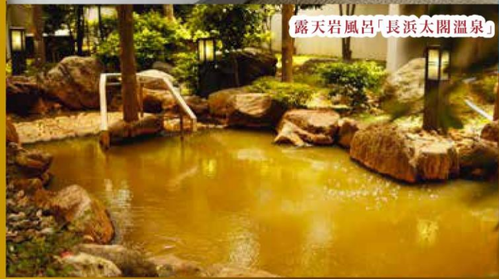
露天岩風呂「長濱太閤溫泉」