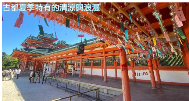
古都夏季特有的清涼與浪漫

置身於京都具象徵意義的神社——平安神宮，在夏季期間限定舉行的「七夕風鈴祭」，將整個境內點綴得宛如夏日夢境。重要文化財「回廊」與神苑「泰平閣（橋殿）」懸掛約 1,500 個風鈴，微風拂過時清脆涼音迴盪耳畔，帶來古都夏季特有的清涼與浪漫