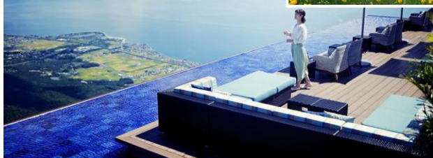
賞日本最大的湖泊！ 纜車×夢幻湖景×空中咖啡廳

從標高 1,100 米的山頂俯瞰日本最大湖泊「琵琶湖」，湖面交織出如詩如畫的夢幻景致。僅需乘坐約 5 分鐘纜車即可從山腳直達山頂，沿途可透過玻璃車廂欣賞琵琶湖全景。除了拍照打卡，還可以前往景觀咖啡廳「Terrace Café」，購買甜點與熱飲，邊享用邊欣賞湖景，享受靜謐的午後。