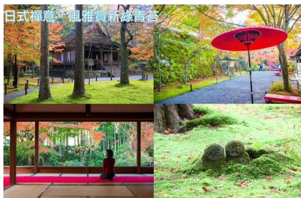
日式禪意·風雅賞新綠青苔

三千院的所在地「大原」位於京都市的東北山中，擁有豐富的大自然，自古以來是貴族及修練佛教的人為了遠離世俗而隱居的地方。華麗的殿宇、精心設計的庭院、鮮豔的花草營造出優雅美麗的景緻，是京都人的私房景點。從客殿進入三千院，第一個讓人讚嘆的池泉迴游式的山水庭園「聚碧園」，巧妙的設計下光影強化了石頭與植栽的輪廓，使庭園富有層次、鮮明。而「往生極樂院」前為高大杉樹參天，底下是茂密生長的青苔，而建築旁是大原之里的呂川和律川引流之池泉流水。夏天時，在樹蔭與青苔包圍之下，著實讓人流連忘返！金色堂台階旁的金色水據說可保佑長命百歲。