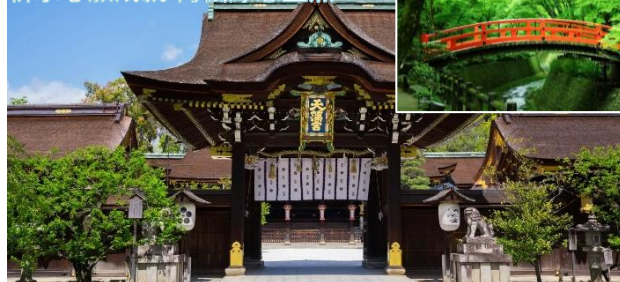
祈求心願成就 青楓綠意盎然！

是京都著名的學問之神「菅原道真」的總本社。保留著以桃山時代華麗絢爛的建築風格為特色的「御本殿」、「三光門」、隨處可見能帶來好運的「撫牛」。楓葉苑是境內特別開放的庭園，擁有約 350 株楓樹，秋天紅葉燦爛，初夏則是青楓清新，呈現截然不同的風情。嫩綠的楓葉映襯溪流與石橋，營造出清涼感。觀賞石橋、溪流與綠楓交織的景色。