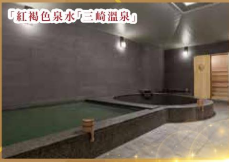
「紅褐色泉水」三崎溫泉