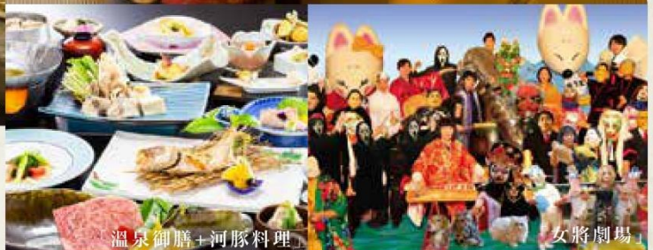
「溫泉御膳+河豚料理」