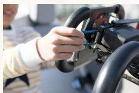
油門由右手操作 油門由右手操作，握住方向盤右側後方的藍色拉桿以加速。

※出於安全考量，未滿 2 歲不可參與 ※如預約滿席/休息，將退還 HK$100(未滿 2 歲除外)