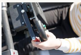
剎車由左手操作 煞車是方向盤左後方的紅色拉桿。