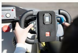
換檔請用左手手指操作 使用方向盤左側的按鈕換檔。