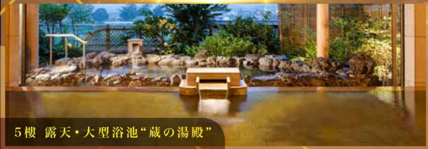
5樓 露天・大型浴池“藏の湯殿”