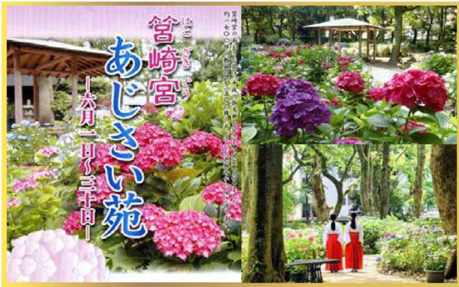
MIYAZAKI 日本三大八幡 宮總本社 宮崎宮

在熊本南部山區的人吉盆地，有超過20家蒸餾所正製作球磨燒酒，其釀酒業在九州已有逾450年歷史。博物館有介紹江戶時期傳統燒酒的製法。而相連的「白岳」傳承藏館，可試勻其品牌的燒酒。