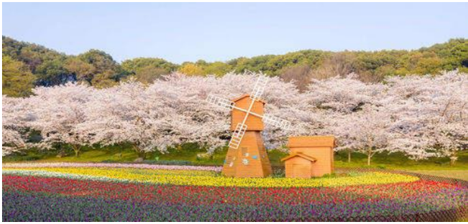
【上方山國家森林公園】賞櫻