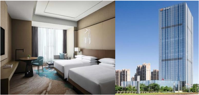
【杭州 國際品牌】 臨安萬豪酒店