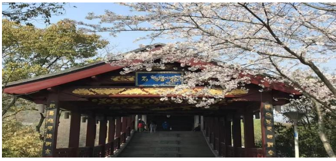
【長廣溪國家濕地公園】賞櫻