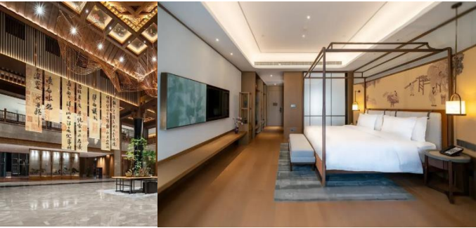
【窯湖小鎮】 窯湖大酒店

【東坡肉】是杭州名菜，東坡肉的美味不僅在於其入口即化的軟嫩口感，更在於濃郁的湯汁與五花肉的完美結合。這道菜的風味獨特，層次豐富，令人回味無窮，為中國美食中的瑰寶之一。