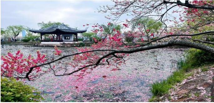
【蠡園】3 月賞桃花、4 月賞紫藤花