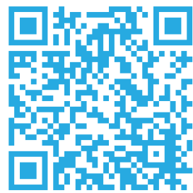
精彩片短重溫回顧