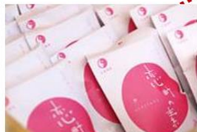
- 戀來井戶 -

可以在廣場裡的小箱購買空樽(約 200 日圓)，裝下旁邊一直湧出的源泉 100% 的美肌溫泉水，帶回家作爽膚水使用。 ※保質期為 5 天