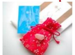
- 玉作湯神社 -

內有許願石，只要手摸它許願，有機會夢想成真。若把神社的願望成真石(約 600 日圓)與許願石相碰後許願，更可將許願石的力量帶回家。