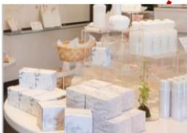
- 姬 LABO -