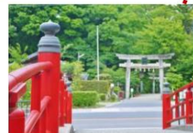
- 宮橋 -

日文中鯉魚與戀愛同音。傳說把魚糰(約 100 日圓)投進井旁的河溪，如果有鯉魚出現，代表戀愛能夠成真。