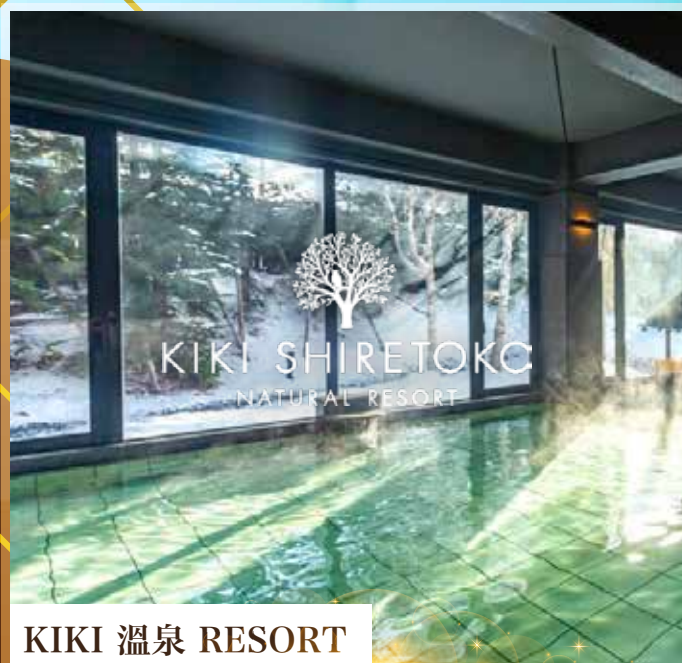
KIKI 溫泉 RESORT

入住知床北辛夷溫泉/知床KIKI溫泉，可每位每晚 HK$1800提升入住 型格私人溫泉房間 (500-600呎)