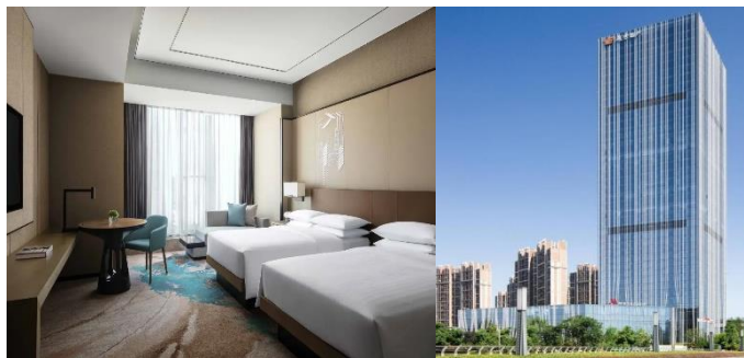
【杭州 國際品牌】 臨安萬豪酒店