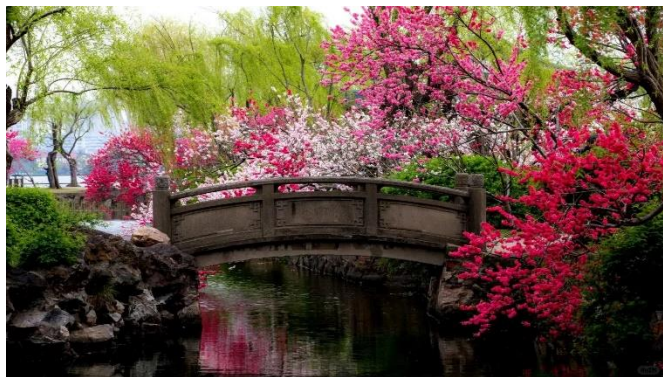
【蠡園】🌸 2 月中旬~下旬賞梅花