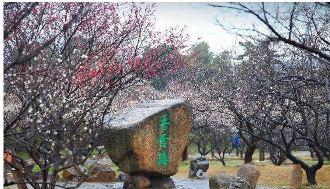
康熙乾隆【香雪海】🌸 10~28/2 出發賞梅花