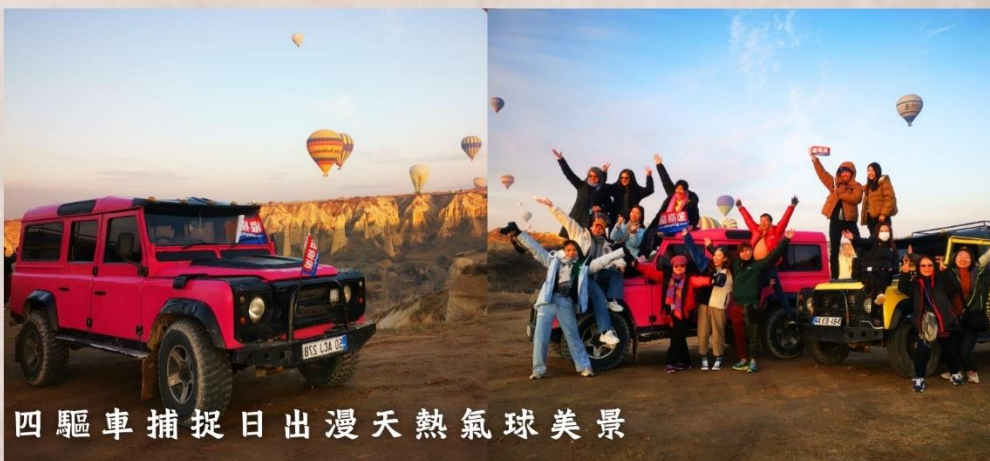
四驅車捕捉日出漫天熱氣球美景