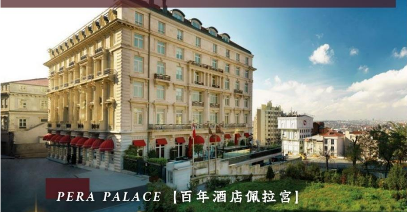
PERA PALACE [百年酒店佩拉宮]