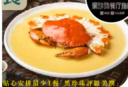
貼心安排最少1餐「黑珍珠評級美饌」