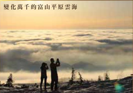
變化萬千的富山平原雲海

酒店內用的水都是附近天狗山的湧泉，是當地非常自豪的名水，而大浴場採用落地大玻璃，可以一邊舒舒服服的泡澡，一邊享受大日連峰的美景，視野絕讚！