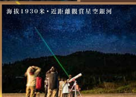
海拔1930米・近距離觀賞星空銀河