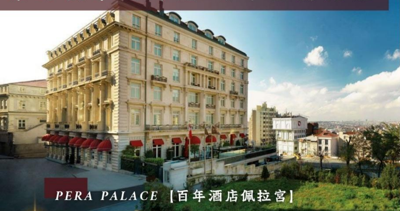
PERA PALACE [百年酒店佩拉宮]