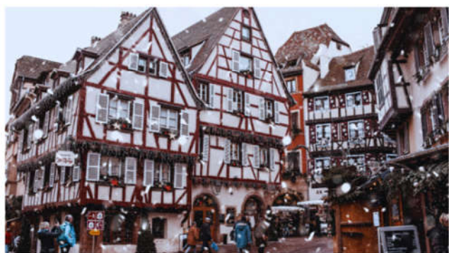
中世紀建築小鎮「聖特拉斯堡」

建於十二世紀，位於德國的萊茵河，是通往萊茵河中流山谷的大門。有“酒城”之稱的呂德斯海姆是萊茵河上的樂園，這裏是萊茵區的中心區，也稱葡萄酒區，年產2700萬瓶葡萄酒。