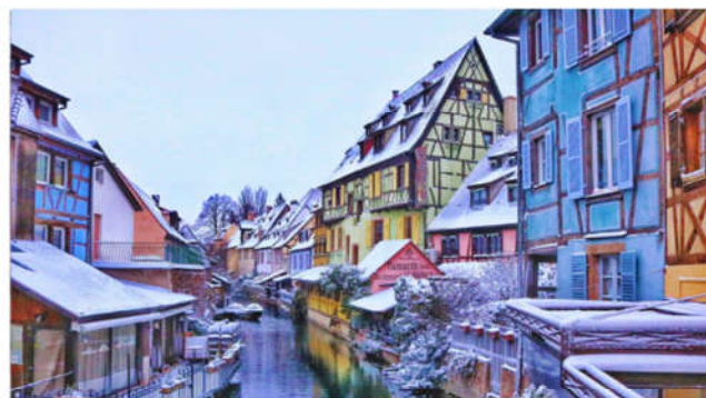
最夢幻的童話小鎮「科爾瑪」

保留有中世紀時期以黑白木構架，如童話般美麗的建築。於1988年，史特拉斯堡大教堂與小法蘭西區域被聯合國教科文組織列為UNESCO世界文化遺產。