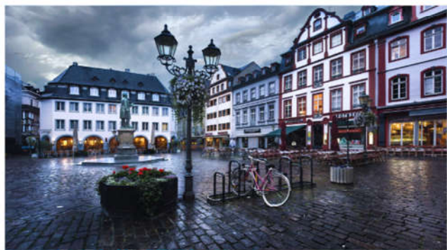
兩大河匯合之處「科布倫茲」

科布倫茲位於萊茵河和摩塞爾河兩河匯合之處，風景優美，是個讓人心情開朗的小城。於二次大戰中城市受到相當嚴重的破壞，所以城內新建築相當多，許多有歷史的教堂、城堡、要塞、宮殿還是復原的相當好。