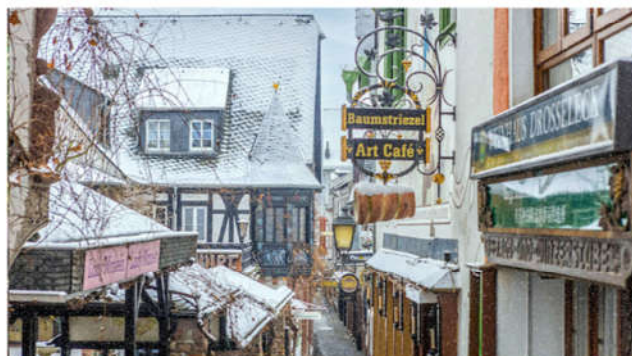
保留古早德國建築「呂德斯海姆」

科布倫茲位於萊茵河和摩塞爾河兩河匯合之處，風景優美，是個讓人心情開朗的小城。於二次大戰中城市受到相當嚴重的破壞，所以城內新建築相當多，許多有歷史的教堂、城堡、要塞、宮殿還是復原的相當好。