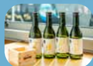
名水及富山米釀成 有名富山地酒(約900-1300日圓)

一大特色是在設有現場調理料理的開放式廚房，嚴選來自富山灣時令食材，即場製作 富山灣壽司、海鮮小菜及茶碗蒸 ，以舌尖細細品嚐富山大自然的肥沃豐饒。甜點則享用 富山百年老舖「引網香月堂」土生菓子 。登車時，還會提供迎賓飲品— 高岡國吉蘋果汁 ，天然蘋果的甜味充分保留，不加一滴水。