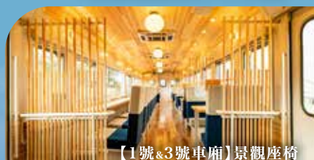
【1號&3號車廂】景觀座椅