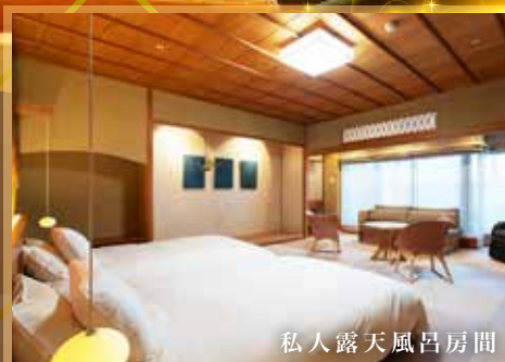
私人露天風呂房間