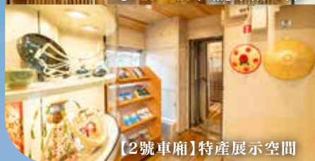
【2號車廂】特產展示空間