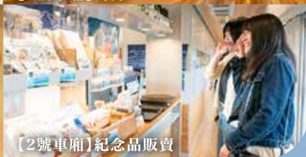
【2號車廂】紀念品販賣