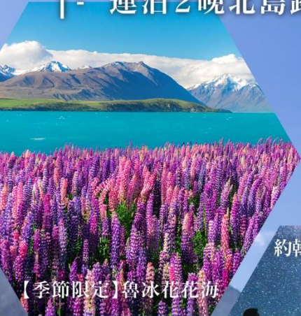
【季節限定】魯冰花花海