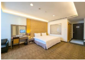
【南投 日月潭】 承萬尊爵渡假酒店