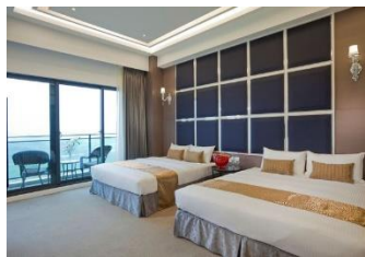
【嘉義】 仁義湖岸大酒店