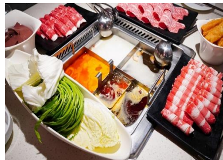
中國規模最大火鍋店【 海底撈火鍋 】

多種海鮮現炒暢吃！鮑魚撈飯扇貝帶子全有，還有現撈海鮮區，各種蟹類、貝類活跳跳水裡自由來，再以蒸鍋和火鍋烹煮，還有烤物區、煎物區，愛吃海鮮的人必來一試。