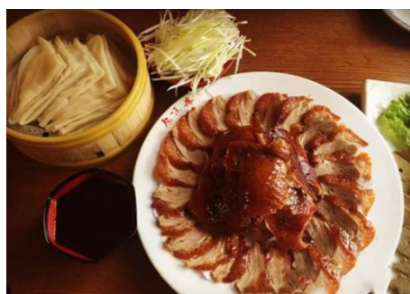
百年老店【 原味齋烤鴨 】

始於乾隆年代，以果木烤鴨子著名，廚子以熟練的手法，將剛出爐帶有果木的烤鴨，切出一片片皮肉，用粉餅包裹來吃，入口肥而不膩，香酥美味。