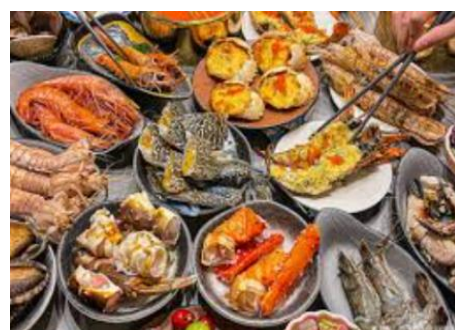
人氣熱搜【 錢庫里海鮮自助餐 】

以薄而有韌性的餅卷，搭配各種東北家常炒菜或配菜捲起來食用。而「春餅」本身是一種傳統的中國麵食，在立春時節食用，有著喜迎春季、祈求豐收的意義。