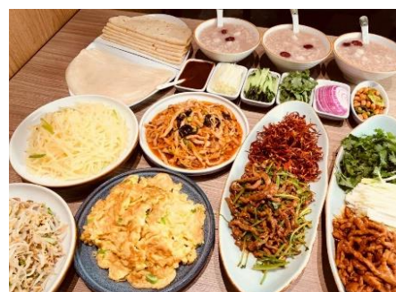
東北必食【 大地春餅 】

始於乾隆年代，以果木烤鴨子著名，廚子以熟練的手法，將剛出爐帶有果木的烤鴨，切出一片片皮肉，用粉餅包裹來吃，入口肥而不膩，香酥美味。