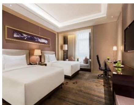
【丹東】 富力萬達嘉華酒店 (約 400 呎)

酒店位於南關嶺商業圈，毗鄰大連市體育中心，交通便捷，地理位置優越。擁有 427 間現代風格的寬敞客房。