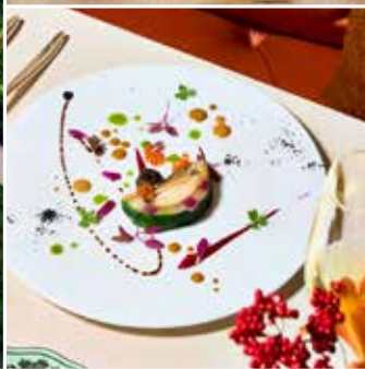
※餐食圖片只供參考，餐食安排以當地接待安排為準。

セントレジス ホテル 大阪 大阪本町の最高級ホテル 連泊2晩(約430-460呎)