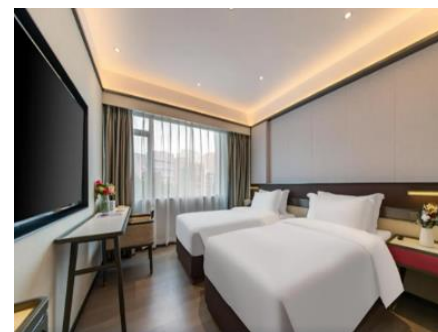
郴州【府上酒店】 (約 320 呎)