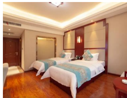
鳳凰古城【鳳凰國賓酒店】 (約 330 呎)