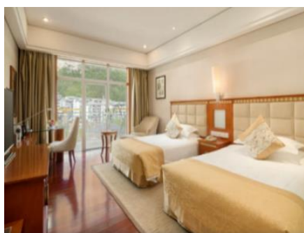
張家界【青和錦江國際酒店】 (約 340 呎)