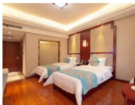
鳳凰古城【鳳凰國賓酒店】 (約 330 呎)