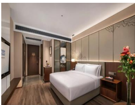
長沙【湘一蔚景溫德姆酒店】 (約 330 呎)